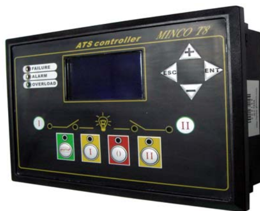
MINCO T8 外观

MINCO T8双电源切换智能控制器的前面板共有一个128×64点阵液晶屏，8个按键和11个指示灯，按键控制ATS的切换，指示灯结合液晶屏指示两路电压和电流的测量及ATS的状态和故障。